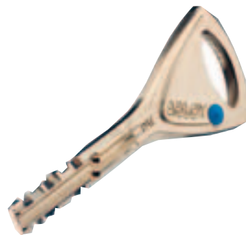
Täysmetallinen, symmetrinen avain

ABLOY® PROTEC on uusi levyhaitateknologian kehitysaskel. ABLOY® PROTEC on huipputurvallinen avainjärjestelmä, jossa on erinomaiset sarjoitusmahdollisuudet.